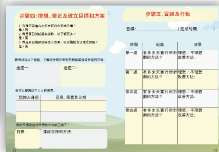
「我的行動承諾」學生手冊