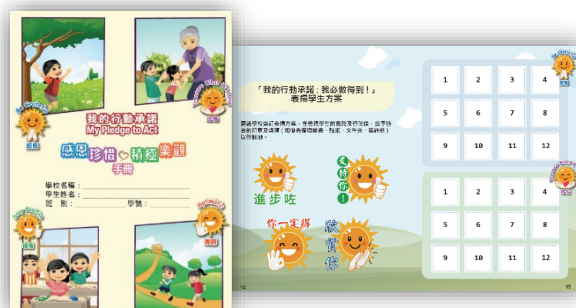
「我的行动承诺」学生手册

为延续「乐诺大使」校本奖励计划的学习成效，我们鼓励学校继续运用由本局所提供的学与教资源、推广物资及「我的行动承诺」学生手册，设计具备校本特色的相关活动，继续举办上述计划；并善用本局制作的「乐诺小太阳襟章」及嘉许状，表扬在实践正确价值观方面表现出色的学生，成为学校的「乐诺大使」。学校更可邀请「乐诺大使」参与校本「我的行动承诺」活动的筹划、宣传及推行工作。上