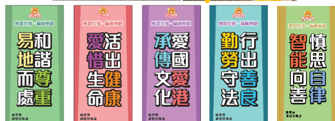
拍照道具及宣傳易拉架（只供參考）

11. 教育局將於 2026 年 9 月向學校發出問卷，以了解學校推廣「我的行動承諾」、校本「同『諾』禮」及價值觀教育的推動情況，請學校積極參與，持續推動價值觀教育。