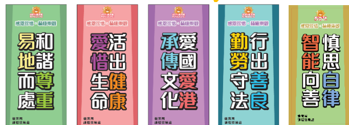
拍照道具及宣传易拉架（只供参考）

11. 教育局将于 2026 年 9 月向学校发出问卷，以了解学校推广「我的行动承诺」、校本「同『诺』礼」及价值观教育的推动情况，请学校积极参与，持续推动价值观教育。